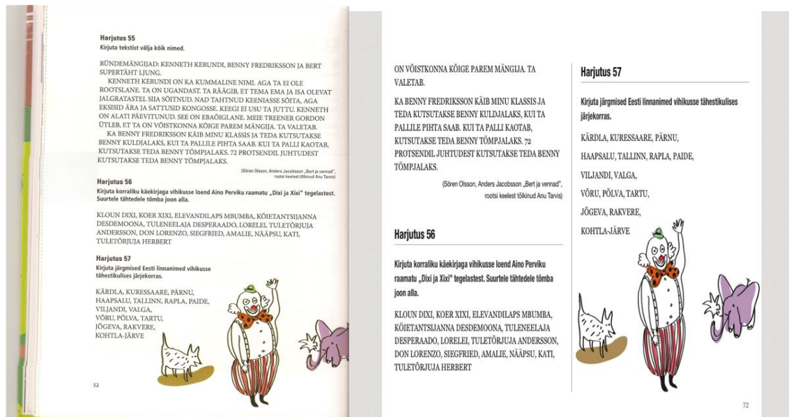
Joonis 2. Paberõpiku lehekülg (vasakul) võrreldes digiõpiku leheküljega, kus on esitatud samad ülesanded.

Lehekülgede paigutamisel on arvestatud ka lehekülje funktsiooni: tavapärased õpikuleheküljed on jagatud kaheks nagu paberraamatu vaates, mis tähendab, et tahvelarvuti ekraan on sellisel juhul horisontaalasendis. Kui aga esitatakse suuremat tabelit või kirjandusteksti, siis on mahutatud lehekülg tervele ekraanile, mis tähendab, et õpikut on kõige mugavam lugeda vertikaalvaates.