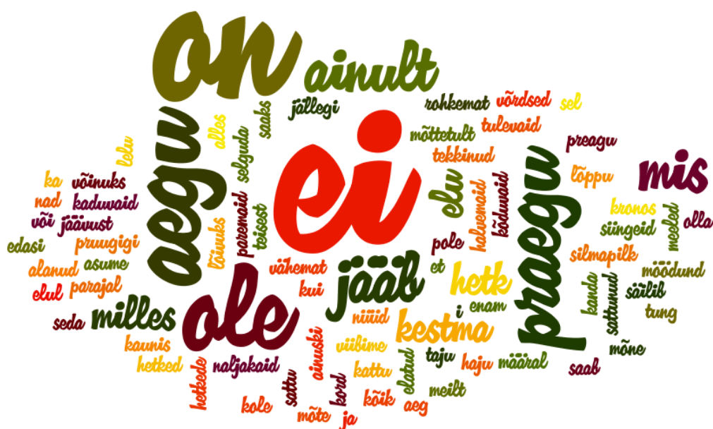
Joonis 3. Artur Alliksaare luuletus "Aeg" Wordle'i sõnapilvena. Salvestatud kuvatõmmisena.

Rakendus annab hea võimaluse välja selgitada, milliseid parasiitsõnu õpilaste tekstis esineb. Samuti võiks sõnapilvesid moodustada ka kirjandusetunnis mõningate tekstide, näiteks novellide, luuletuste või poemide analüüsimise juures. Tunni häälestusfaasis saab sõnapilvede abil ennustada tunnis loetava kirjutise sisu. Koostatud sõnapilve salvestamine on veidi problemaatiline, kuna Java-pluginal on turvakaalutlustel keelatud salvestada arvuti kõvaketale. Sõnapilve võib salvestada kuvatõmmise abil (vt joonis 3) või PDF-failina printides. 17