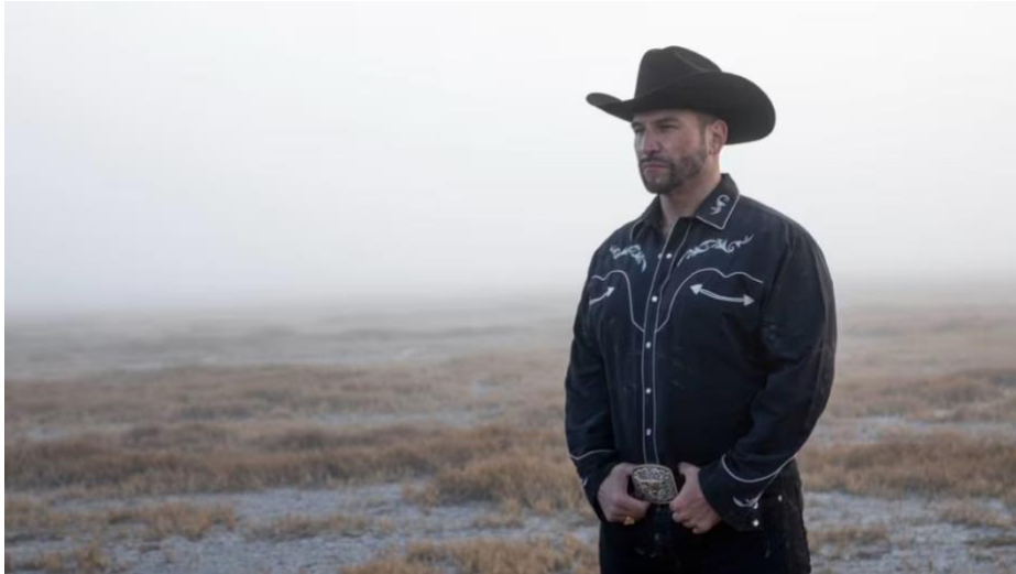
Figura 2: Un ejemplo de la narcomoda en la serie “El Señor de los Cielos”.

La narcomoda para algunos ha convertido en una expresión de estatus y poder, y la asociación de ciertas marcas y estilos con figuras prominentes en el narcotráfico ha llevado a que algunos individuos busquen emular este estilo como una forma de identificación con el éxito y la desigualdad económicos. También podría desempeñar un papel en la percepción de la narcomoda como un símbolo de escape de la pobreza, proporcionando una ilusión de riqueza y éxito.