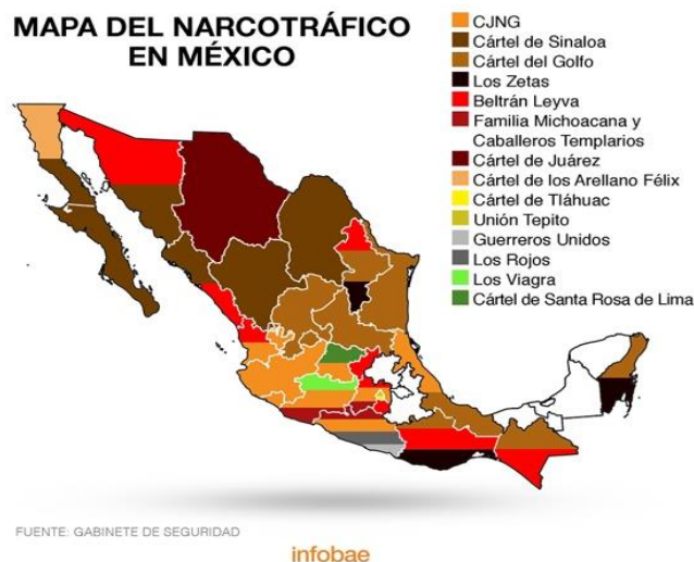
Figura 1: Mapa del narcotráfico en México.

Sin embargo, los cárteles en México no operan de manera estratégica al establecer territorios exclusivos, conocidos como “plazas”, donde tienen control total, impidiendo la presencia de otros cárteles. En la actualidad, destacan el Cártel de Sinaloa, el Cártel Jalisco Nueva Generación (CJNG), el Cártel del Golfo y Los Zetas como los carteles más conocidos y dominantes. (Infobae 2021). En el mapa adjunto (Figura 1) ilustra la división territorial entre estos carteles, revelando las zonas bajo su control exclusivo. Esta delimitación territorial no solo caracteriza la operación del narcotráfico, sino que también desencadena violentas disputas entre carteles por la expansión territorio, el aumento de poder y el control de recursos financieros.