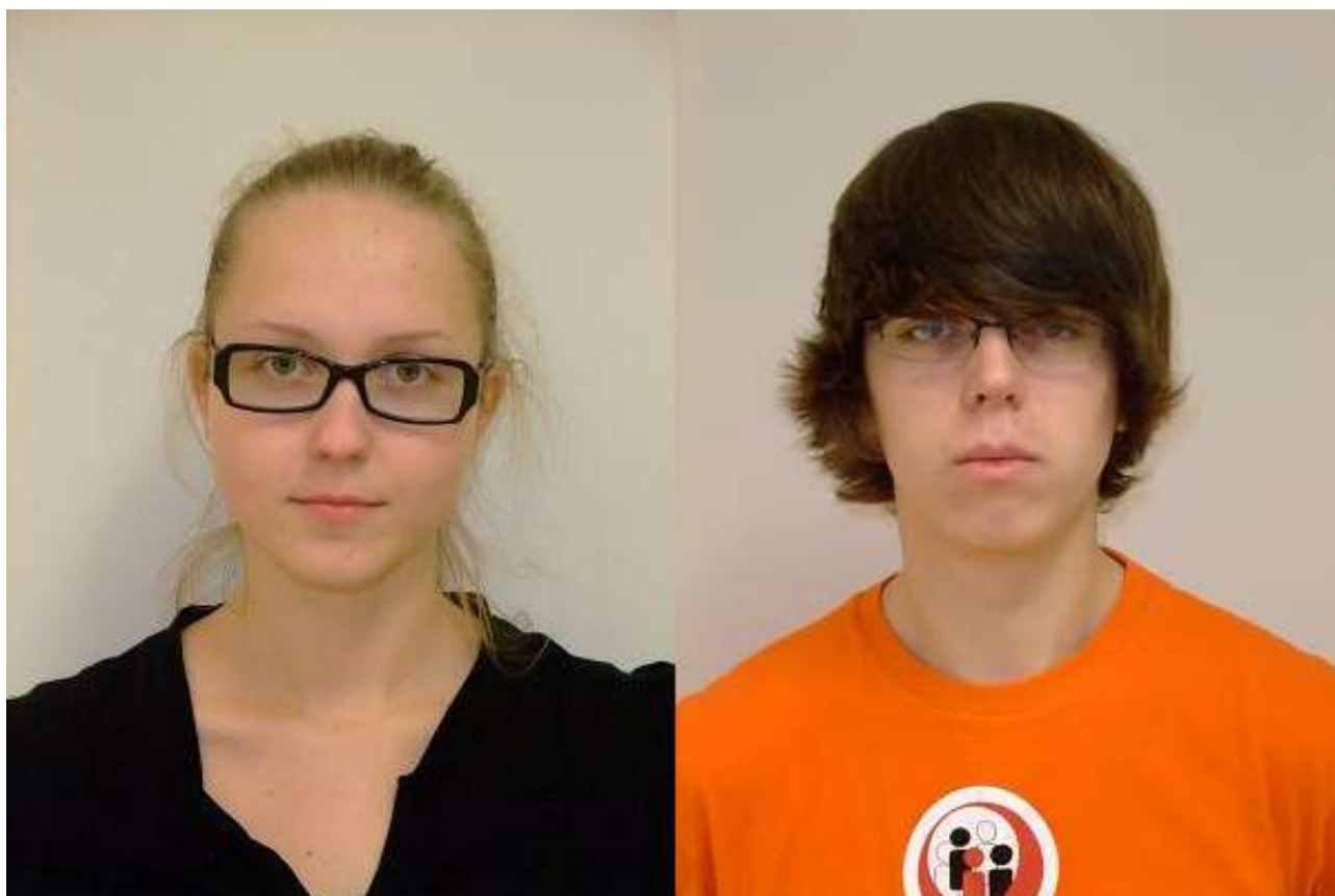
Joonis 1: Piltide näidised

Kõigist katseisikutest tehti kolm pilti. Rohkem kui ühe pildi tegemise eesmärk oli välistada võimalikke pildistaja- või pildistatavapoolseid ning keskkonnast tingitud vigu. Nii Tallinnas kui Tartus asetati pildistamisel fotoaparaat stabiilsele kindlale pinnale.