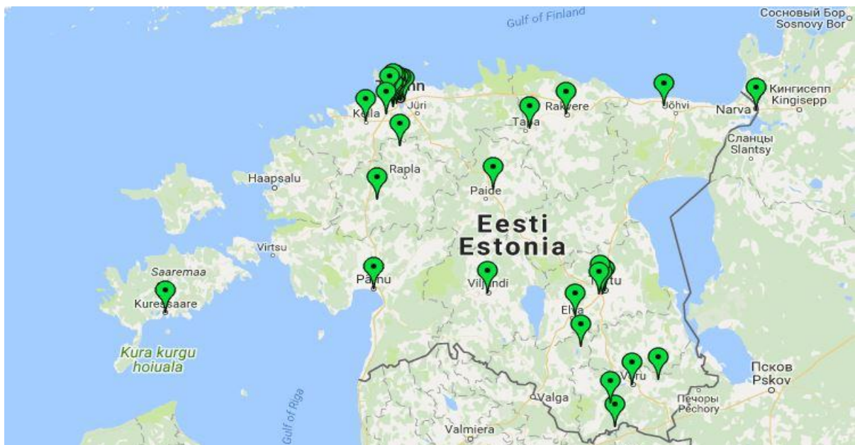
Joonis 1. Erakoolide asukohad 2016/2017. õppeaastal (Eesti Hariduse Infosüsteem, 2017)

Erakoolide populaarsuse kasvu kinnitab ka fakt, et erakoolid on suutnud oma õpilaste arvu oluliselt kasvatada olukorras, kus üldhariduskoolide õpilaste arv tervikuna on langenud (Eesti Hariduse..., 2017). Õppeaastate 2005/2006 ja 2016/2017 vahel on üldhariduskoolides käivate laste arv vähenenud üle 30 000 võrra (HaridusSilm, 2017). Kõige rohkem on õpilasi vähemaks jäänud gümnaasiumiastmes ja kolmandas kooliastmes. Teises ja esimeses kooliastmes on õpilaste arv samas kasvanud. Sama ajaga on koolivõrgust kadunud 78 kooli. Oluliselt on vähenenud gümnaasiumide (72 kooli vähem) ja algkoolide arv (33 kooli vähem). Samal ajal on kasvanud põhikoolide arv 264-lt õppeaastal 2005/2006 291-ni õppeaastaks 2016/2017 (HaridusSilm, 2017). Eestiga sarnane trend iseloomustab ka Taani koolivõrku, kus munitsipaalkoolide arv väheneb ja erakoolide arv kasvab (Taani laste, hariduse..., 2016).