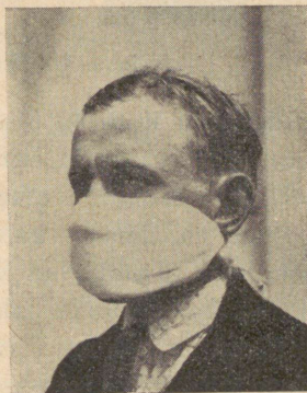
Joon. 3. Marli vahele asetatud puuvillavatt, tolmuksaitseks.

riol , uspulun ja uspulun-universal ; 2) tolmpuhised: ceresan , tillant ja tutan .