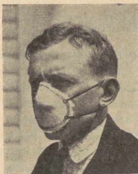
Joon. 2. Tolmumask traatvõrgust, mille vahel on puuvillavatt.

Puhtimisvahendeist on meil müügil praegu eranditult Saksamaa preparaadid: 1) m ä r g p u h i s e d: germisan , fusa-