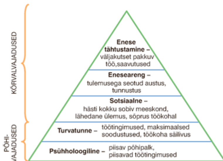
Joonis 1. Maslow viieastmeline vajaduste püramiid ((Virovere, Alas, Liigand 2004: 61)