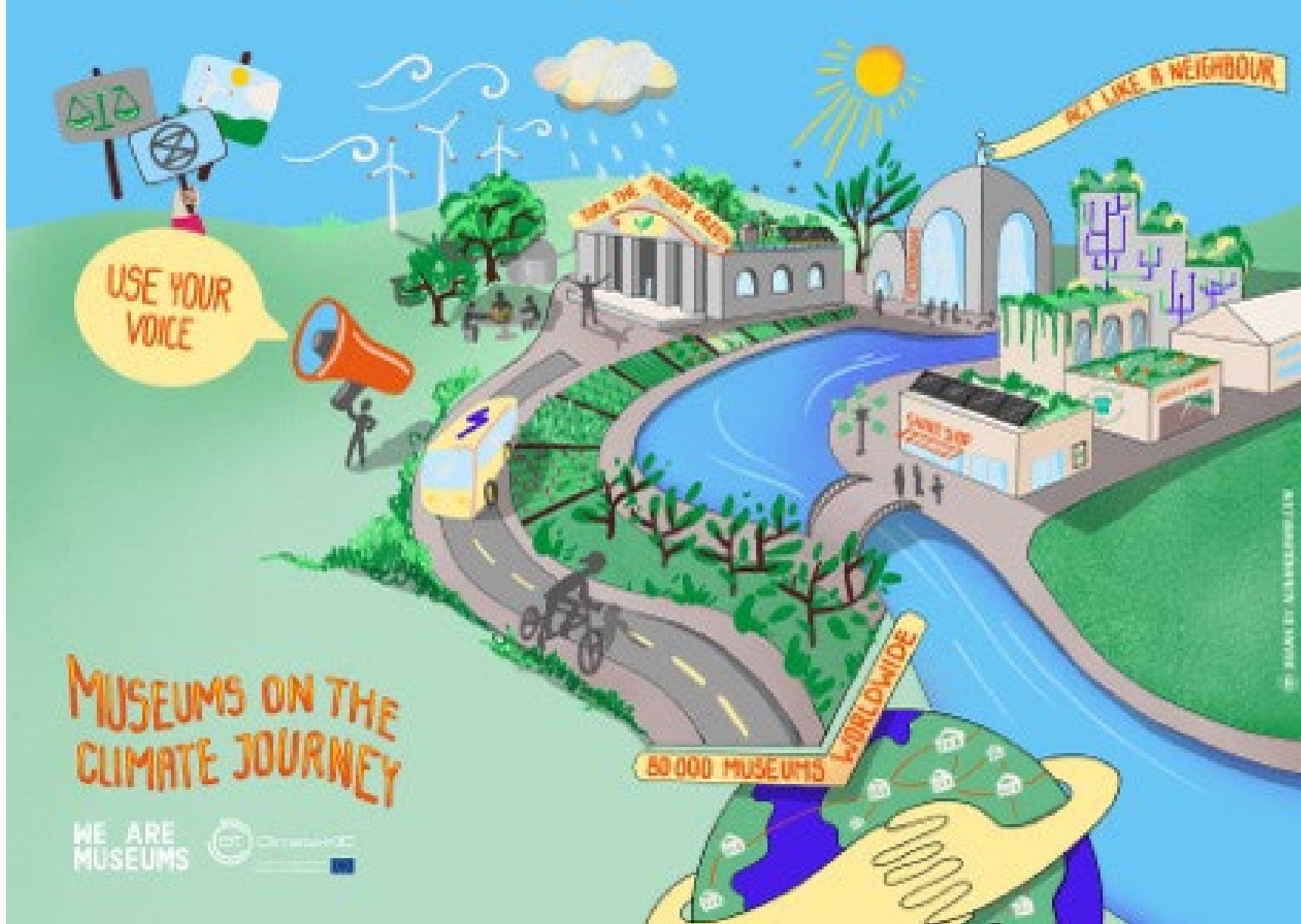
‘Museums On the Climate Journey’, We Are Museums, kujundus Alina Holtmann www.weare museums.com/museumsonetheclimatejourney