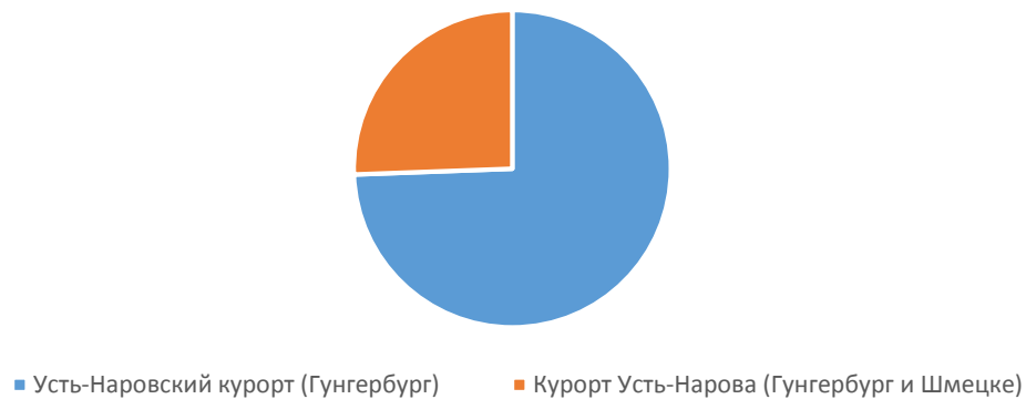
Joonis 1.3. NIMED EESTIKEELSETES AJALEHTEDES “EESTLANE”, “KAJA”, “PÕHJANAEL”, “WIRMALINE”