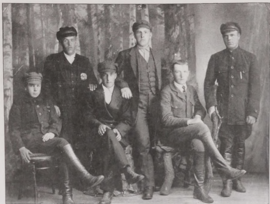
Joonis 39. ... vat need mehed kõik. Vaata, kui kenad need tema küla mehed kõik ... Humalasaari noormehed 1917. aastal.

Mälestused kaotatud kodukülalt muutuvad aastate jooksul enamasti ainult nostalgilisemaks (Laaksonen 1982:59). Mälestus füüsilisest Ingerimaast on nii ilus, et seda saab kirjeldada ainult kõige positiivsemalt. Kodukoht koos linnulaulu, mäe otsas kõrguva kiriku ja taamalt kostvate kirikukelladega tundub paradiisisarnane. Isegi inimesed olid Ingerimaal inglisisarnased olevused, kes ei teinud ühtegi halba tegu ega eksinud kristlike eetikareeglite vastu. Pole ime, et taolise elukeskkonna kaotamine on taganumist vääriv. Samas peab meeles pidama, et tegemist on mälestustega Ingerimaast või õigemini sellega, mida sellest mäletada taheatakse, mitte Ingerimaa endaga. Mälestustel on aga omadus aastate jooksul aina ilusamaks ja nostalgilisemaks muutuda.