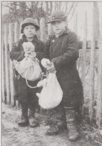
Joonis 7. Kerjusepoisid 1943. aastal Kallivere külas. Foto: Antti Hämäläinen. Museovirasto SUK 530:171

Meie, lapsed, seisime tihti sakslaste juures järjekorras. Nad ikka valasid meile katelokist, neil jäi üle. "Butterbroti" anti. Ema pidi peaaegu ära surema. Ta sai meiereisse tööle ja kui esimest korda seda lõssi või mida tahes jõi ... Ta oli ju näljas ja sai korraga liiga palju valku. Kord leidsime pöönin-gult lehmanaha ja siis sellest keedeti sülti. Mul on see lõhn siiani meeles (naine, s 1933).