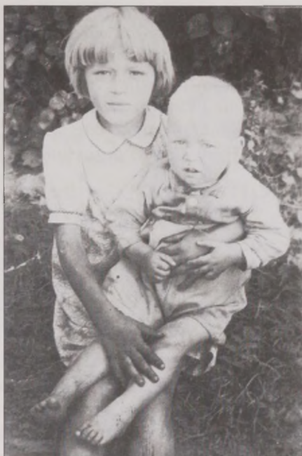
Joonis 12. ... ja siis tulime Eesti. Õde-venda leidsid endale kodus Valgamaal, kus rändfotograaf neist 1947. aastal esimese pildi tegi. ERM Fk 2786:57

“24 tundi” kordub paljudes narratiivides hirmutava kogemusena, mida prooviti vältida enese varjamise või kalli raha eest teise nimega passi ostmise teel. Eestisse tulemine ei tähendanud veel kõigi murede kadumist ja rahuliku elu algust, kuna ees seisis veel üks katsumus, mis samuti seotud väljasaatmisega. Kahjuks ei ole seetõttu võimalik määrata pärast sõda Eestisse asunud ingerisoomlaste arvu, kuna aastatel 1947-50 saadeti nad siit välja. Nüüd said ingerisoomlastest nõu paberitega “isamaa reeturid”, kuna nende passides oli nüüdsest märges “§ 58”, mis VNFSV Kriminaalkoodeksi järgi käib “isamaa reeturite” kohta ja mille kohaselt “kodumaa reetmise, st tegude eest, mis on toime pandud NSVL kodanikkude poolt NSVL sõjalise võim-