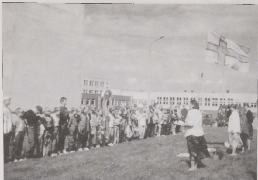
Joonis 26. Laste suvelaager 1996. aastal Taebblas.

Varem me ingerisoomlastest eriti ei teadnud. Turu tänaval mul elasid kooliõedki ... kirikus esimest korda nägin neid. Kirik hakkas kuus-seitse aastat [intervjuu toimus 1996 aastal] tagasi. Ingerisoomse Seltsi liikmeks ma ei ole astunud, õed on küll. Algul käisin küll seal, aga siis lõin käega. Mõtlesin, et mul ükskõik ... ma olen juba harjunud eestlastega. Mul suurt vahet ei ole, mis rahvus on. Peasi, et inimene on. Kirikus ka suurt vahet ei ole, kas lähen eesti või soome kirikusse. Kui soomest tulevad õpetajad, siis muidugi lähen (naine, s 1920).