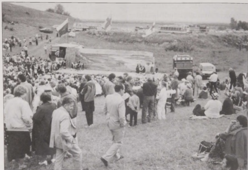
Joonis 28. 1999. aasta "kesäjuhlat" Ingerimaal Tuutaris. 1990. aastate alguses oli jaanipäevaks Ingerimaale sõitmine väga populaarne, nüüd on sõitjaid märksa vähem.

ühisürituselt saadi. Selline koosolemine andis inimestele ettekujutuse ingerisoomlaste arvukusest ja ühislaulud tugevdasid indiviidi identiteedi seda osa, mis seondub Ingerimaaga. Üks naine, kes oli koos emaga Ingerimaalt lahkunud üheksa aasta vanuselt, jutustab ühest sellisest reisist: