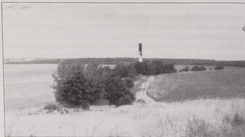
Joonis 18.... 1963. aastal käisime kodukülas, kõik oli võssa kasvanud. Vaade Tuutari kihelkonnas asunud Pajula külale 1963. aastal.

Meie müüisime oma maja ära, kuna ei lubatud minna sinna. Mingisuguse võileiva hinna eest. Ma mäletan, et mingisugused punased saapad mulle tolle eest toodi ja oligi kõik. Minu ema, kui pensionile läks, proovis seal elada. Aga seal olid kõik nii ära venestunud, et tuli ikka tagasi 1974. aastal. Kaheksa aastat proovis ... kõik vanad mälestused, et kui tore oli ... (naine, s 1937).