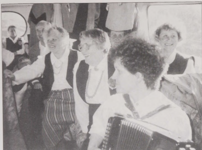
Joonis 25. Narva Ingerisoomlaste Seltsi koor teel Elva laulupeole.