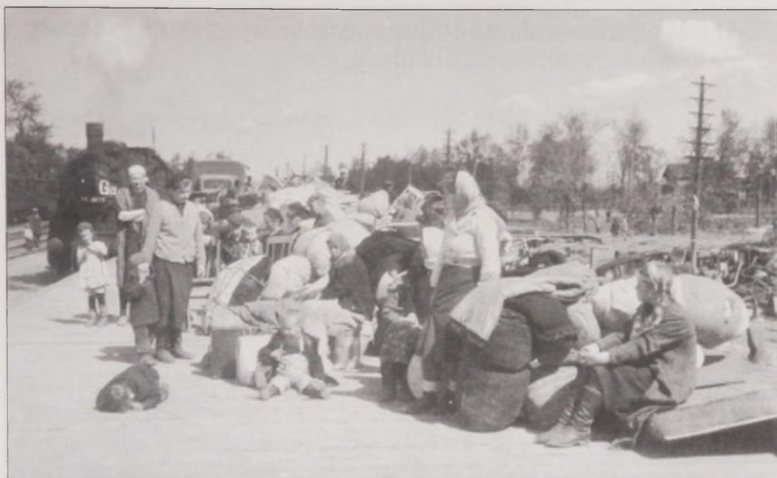
Joonis 5. Kodumaatuse algus. Ingerisoomlased 1943. aastal Gatsšina raudteejaamas enne Soome siirdamist. Foto: Antti Hämäläinen. Museovirasto SUK 530:1729

aastal Soome. Lõpuks pääsesid ingerisoomlased sõjast eemale, kuid nende elulugude põhjal jääb mulje, et sõda on nende elus olnud väga määravaks sündmuseks. Absoluutselt iga informant, vaatamata sellele, kas ta oli sõja ajal väike laps või juba täiskasvanud inimene, mainib sõda kas üldises mõttes või veelgi sagedamini jutustatakse konkreetsetest elamustest või juhtumitest. Sõjast rääkides puudutatakse kõige sagedamini selliseid teemasid, nagu sõja jõudmine Ingerimaale ja pommitamine, saksa sõdurite käitumine, toidupuudus ning sugulastest ja perekonnast äralõigatus.