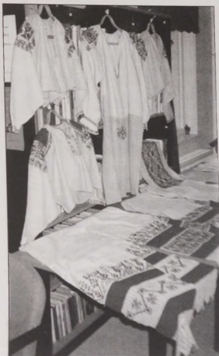
Joonis 34. Eesti Rahva Muuseumi kogudes leiduvad Ingeri esemed eksponeerituna Tartus Eesti Ingerisoomlaste Liidu majas 1999. aasta ingeri päeval. Foto: Riina Reinvelt. ERM Fk 2786:78. Vt värvitahvel V.

käsitlenud aga ainult ingerisoomlasi, vaid ka Ingerimaa teisi rahvaid – vadjalasi ja isureid. Ingerisoomlaste pettumus oli suur ning peale näituse külastamist saatis üks naine muuseumile oma fotoalbumi ning kaaskirjas kirjutas ta järgmist: Küllastasin Ingeri näitust ja näituse lõpus puhkesin nutma. Lootes leida armsaid soomlaste nägusid, tuli pettuda. Vastu vaatasid vene näod ja näitus oli suur pettumus. Ingeri põhirahvuseks olid soomlased (180 000). Vene poliitika alusel kaotas rahvas nii isamaa kui emakeele . Rahvast ei lubatud Ingerimaale tagasi, selle vallutasid venelased.