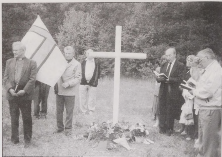
Joonis 8. Mälestusjumalateenistus Põllküla ühishaual, kuhu on maetud tuhatkond sõja ajal Eesti koonduslaagrites nälga ja haigustesse surnud ingerisoomlast.

Ingerisoomlased ei saanud nälga tunda ainult sõja ajal, vaid ka pärast nende küüditamist Kesk-Venemaale. Nad saadeti mahajäänud paikadesse, mis asusid kaugel suurtest keskustest. Lisaks eelnevatele kolhoosiaastatele oli ka sõda mõjutanud elamistingimusi nendes piirkondades. Kohalikel inimestel nappis endalgi toidust, mis siis veel rääkida südatalvel saabunud uusasukatest. Esimese talve aitasid üle elada Soomest kaasa võetud toidukraam ja majapidamisriistad ning riided, mida sai esialgu toidu vastu vahetada. Paljud üritasid leida tööd, kuid kõigis piirkondades ei olnud isegi see võimalik. Mõnel pool oli tööd, aga vaatamata sellele oli olukord halb, kuna palga maksmiseks ei olnud vaestel Venemaa kolhoosidel ei raha ega toiduaineid. Vastu kevadet tuli paljudel siiski nälga kannatada (Reinvelt 1997:38).