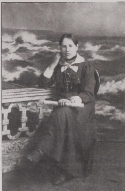
Joonis 40. ... ja nüüd, kui ma Sulle ütlen – ingeri naised on väga ilusad! Kaunitar Hakaja külast umbes 1915. aastal. Foto: ERM Fk 2786:14