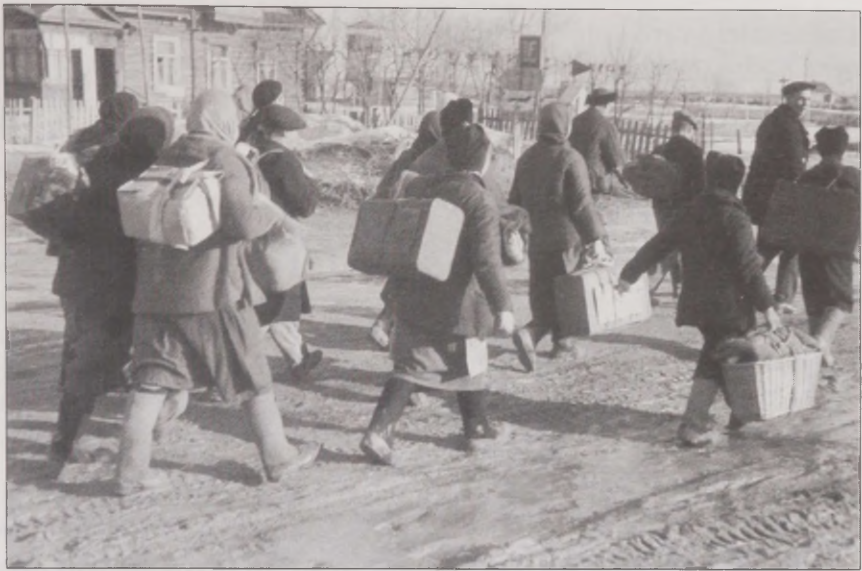
Joonis 6. Nälg pani inimesed sõja ajal kodudest lahkuma. Foto: Antti Hämäläinen. Museovirasto SUK 530:598

nähtud filmidele olemas ettekujutus, kuidas ühest või teisest ajaloolisest sündmusest peaks rääkima. Ja tänu nõukogude propaganda- ja filmitööstusele on kõik Nõukogude Liidus elanud inimesed saanud selgeks vähemalt sõjast rääkimise mudeli.