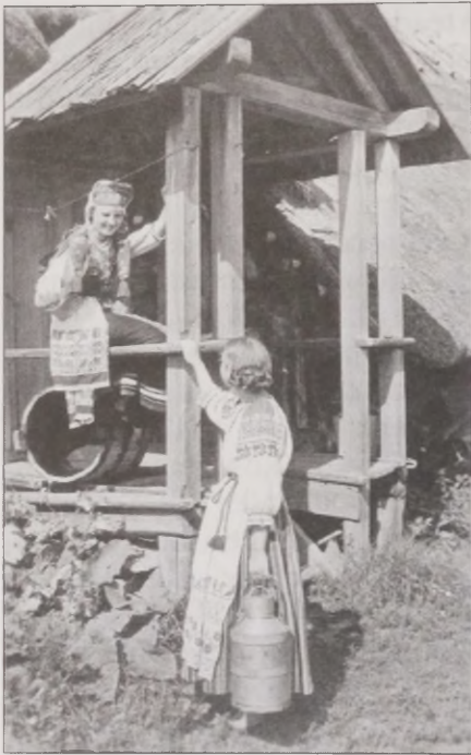
Joonis 41. Piltpostkaart Eesti-Ingerist 1930. aastatel.

neist saadud elamused ning kogemused. Iga sõlmteema on seotud ühe konkreetse sündmuse või kogemusega, kuid viimased moodustavad omakorda sündmuste ahela, kus üks sündmus teisest välja kasvab ja üks kogemus järgmise ni viib. Kõik saab alguse Teisest maailmasõjast, mis ingerisoomlaste jaoks markeerib kodumaatuks jäämist ja rahvusliku identiteedikriisi algust. Rääkides isiklikult kogitud füüsilistest raskustest ja vaimsest ning poliitilisest terrorist, jutustavad informandid tegelikult oma perekonna, küla ja kogu Ingerimaa saatusest ning sellega seonduvast kollektiivsest kogemusest. Seoses sõja ja küüditamisega enesele osaks saanud raskest saatusest ja kannatustest rääkides tunnetatakse enese kuul-