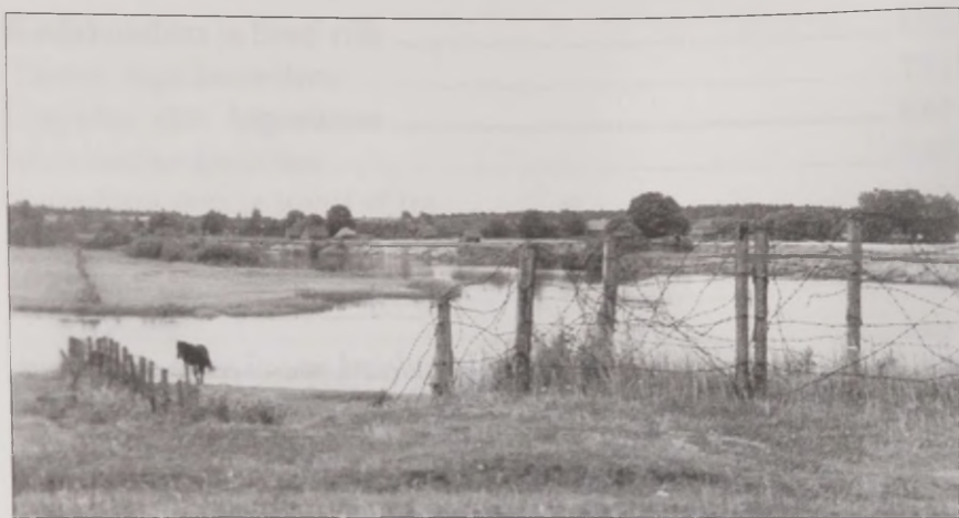
Joonis 1. Eesti-Vene piir Eesti-Ingeris 1920-1940.

Antud uurimuses tuleb aga juttu peamiselt Lääne- ja Kesk-Ingerist (vähesel määral ka Põhja-Ingerist) pärit põgenikest, kes asusid Eestisse pärast Teist maailmasõda. Vanemad inimesed enamasti mäletavad, kuidas nn ingerlased 1 sõja järel Eesti küladesse ilmusid ja taludes tööd ning elamispaika otsisid. Paljude eestlaste klassikaaslaste hulgas on olnud mõni Hämäläinen, Rittari või Virolainen, kuid enamasti ei ole nad ei oma välimuse ega keeleoskuse tõttu eestlastest erinenud, mistõttu ei ole nende päritolusse eriti süvenetud. Eestis oli ja on palju omapäraste perekonnanimega inimesi ja kes jõudis nende kõigi päritolu vastu huvi tunda? Ja pealegi veel selliste vastu, kes näisid eestlastena ja olid omaks võtnud eestlastele omase olemis- ja mõtteviisi.