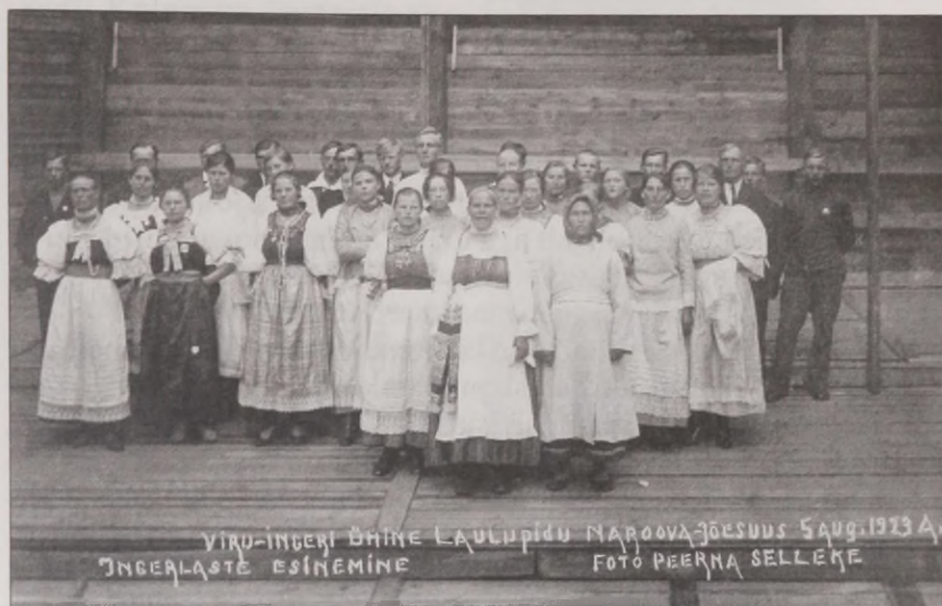
Joonis 2. Viru-Ingeri ühine laulupidu Narva-Jõesuus 05.08.1923. Ingerlaste esinemine.

tulevate põlvete kui ka teisest rahvusest naabrite ja töökaaslaste eest. Kui Eestis algas nn laulev revolutsioon, mis viis ühiskondlike ja poliitiliste muutusteni, hakkasid ka ingerisoomlased tasapisi pead tõstma. Ajakirjanduses ilmus mitmeid artikleid selliste pealkirjadega nagu “Ingerlaste lugu” (Looming 1988, nr 3), “Ingeri ärkab Eestis” (Edasi 16.02.1989), “Kus oled, ingeri rahvas?” (Rahva Hääl 06.08.1989), “Mis juhtus ingerlastega?” (Edasi 25.04.1990), “Kodumaata rahva mälestusi” (Edasi 08.09.1990), “Ingerisoomlased Eestis” (Postimees 17.07.1991), “Nimi reedab” (Eesti Ekspress 31.05.1996). Ühest küljest tõid need artiklid avalikkuse ette ja teadvustasid Eesti ühiskonnale ingerisoomlaste saatuse, teisest küljest oli neil artiklitel ka ingerisoomlaste eneste jaoks äratuslik funktsioon. Paljudele ingerisoomlaste päritolu inimestele oli see esimeseks võimaluseks oma rahva minevikust lugeda ning kogeda, et sama saatuse kandjaid on hoopiski rohkem kui ainult iseenda perekond, suguvõsa ja tuttavad.