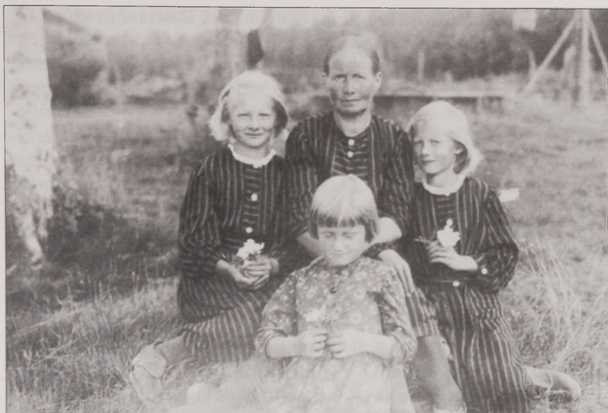
Joonis 9. Ema lastega 1944. aastal Soomes.