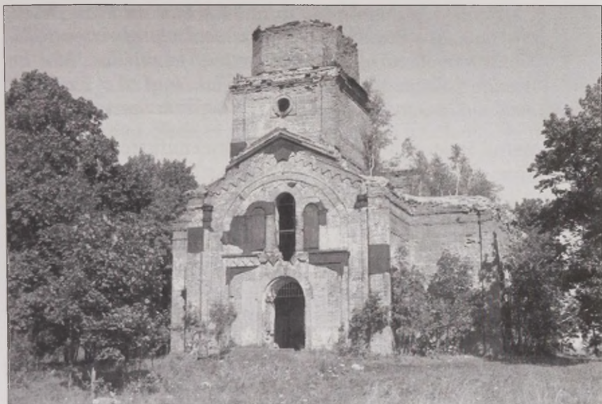
Joonis 19. Hävinud või varemetses olid ka kunagi Ingerimaa uhkuseks olnud kirikud. Soikkola kirik. Foto: H. Douglas. ERM Fk 2311:373

Eestimaale jäämise otsust mõjutas kindlasti ka Eesti üldine majanduslik paremus paljudest Nõukogude Liidu piirkondadest. Nimetati ju Eestit Nõukogude Lääneks, kust lahkumine oleks paljude jaoks kindlasti kaasa toonud elu majandusliku ja olmelise halvenemise.