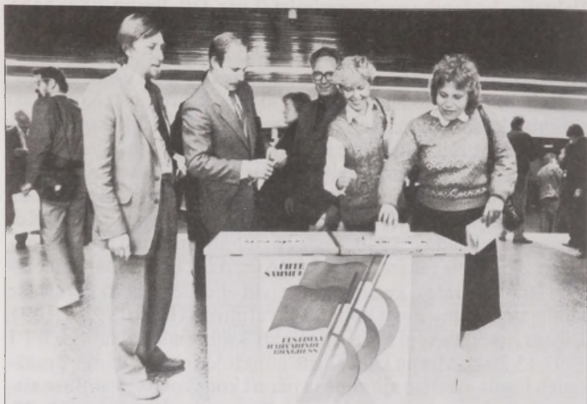
Joonis 30. Ingerisoomlaste esindajad Rahvarinde kongressil 1.-2. oktoobril 1988. aastal

Kodakondsuse seadus, mis roheliste kaartide omanikele enam eelistust ei anna. Mõnede inimeste kibestumise põhjuseks võibki olla “kodakondsuse rongist maha jäämine”.