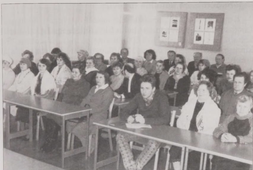
Joonis 22. Võru Ingerisoomlaste Seltsi asutamiskoosolek 26. jaanuaril 1989. aastal.

selle kuulutuse peale rahvas tuli kokku. Esialgu mina kartsin sinna minna. Seal oli kuulutuse peal – “soome rahvusest kodanikud”. Soome rahvusest! Ma ei olnud soome rahvusest. Mul isa oli venelane, mul pidi passis olema vene rahvus. Sest siis nõuti. Vähemalt meil nõuti, et passis peab olema isa järgi rahvus. Oleks ma teadnud, et mul on vaba valik, siis ma oleks muidugi teise võtnud. Õde võttis mul soome rahvuse. Aga ma olin vene rahvusest, ma ei julgenud sinna kohe minna. Aga siis kuulsin, et rahvas läheb ja läksin ka. Mõtlesin, et ma ei pea seal ju kätt tõstma, kui ma ei tohi. Ma võin ju kuulata ainult. Ja siis ma kuulasin. Seal pandi nimesid kirja ... Esialgu rahvas ei julgenud üldse mingeid nimesid kirja panna. Väga paljud jäid lihtsalt istuma. Et me juba nii palju sulasime rahva hulka, rahva keskele, et meid enam ei eristanud keegi. Aga siin järsku me teatame kõik, et me oleme ingerlased. Ja siis kohe teine nimekiri läheb sinna KGB-sse? Väga paljud inimesed kartsid seda. Seda ma tean, väga paljud kohe (naine, s 1947).