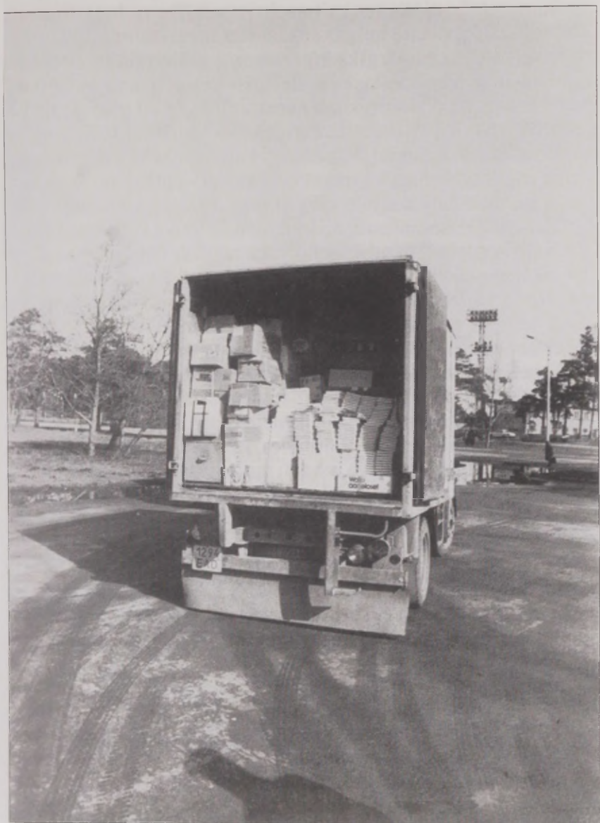
Joonis 23. ... aga keele oli see rahvas enamalt jaolt ära unustanud. 10. aprillil 1989 saabus Soomest esimene koorem soomekeelseid raamatuid, mida oli vaja soome keele meeldetuletamiseks ja õppimiseks.