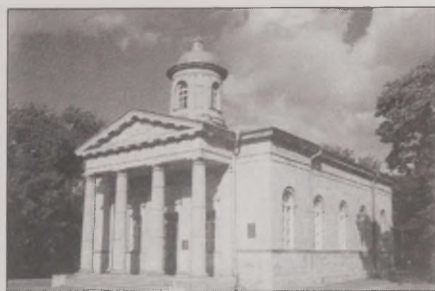
Joonis 38. ... seitse kilomeetrit oli meie kirikuni ja see kohe säras seal mäe otsas! Taastatud kirik Gatšinas. Vt värvitahvel III

See, kuidas indiviid kohta (regiooni) eristab, ei seisne mitte täpselt füüsiliste mõõtmete ja vormi fikseerimises, kuivõrd tähendustes, mille kogukond sellele omistab ja nende tähenduste jätkuvuses põlvkonnalt teisele (Paasi 1996:208; tsit Relph 1976). Isegi, kui füüsiline keskkond muutub, säilivad mälestused sellest, milline see paik oli varem ja need mälestused aktualiseeruvad aeg-ajalt (Runnel 1998:45). Teisele maale kolides võetakse kaasa mälestused, mitte “kodumaa” ise.