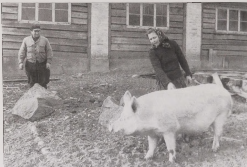
Joonis 14. Paljud ingerisoomlased leidsid töökoha põllumajanduses, kus nende tööst lugu peeti. Foto: ERM Fk 2786:29

Kümneks aastaks jäime Väimelasse Sassi sovhoosi. Rahvas oli seal tore, inimesed tulid kaema. Sassis sain ministeeriumi aukirja [Ülemnõukogu Presiidiumi aukiri 14. maist 1954. Kõrgete töötulemuste saavutamise eest 1953. aastal ning edusammude eest sotsialistliku põllumajanduse arendamisel]. Soorus sain töövapruse ordeni [Tunnistus omistatud üleliidulisest põllumajandusnäitusest osavõtjale 1958. aastal, töövapruse medal "Esimese Mai" kolhoosi seatalitajale]. Aukirju ja neid ordeneid on nii palju (naine, s 1915).