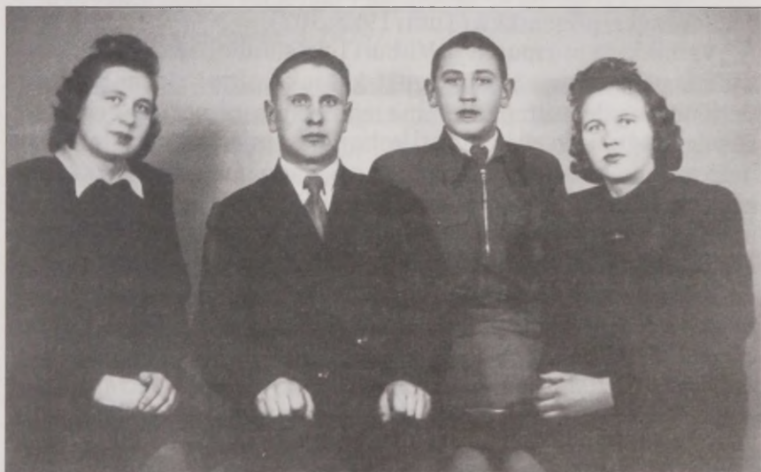
Joonis 10. ... aga ema ütles, et läheme ikka, et me vennas on seal. Õed-Vennad 1949. aastal Eestis, mil oli taas kohtunud Punaarmee teeninud vennaga.