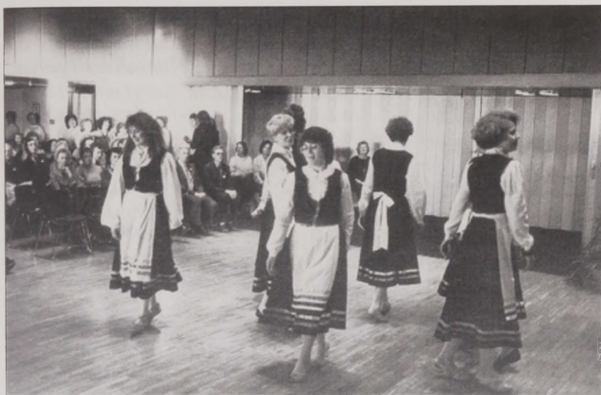
Joonis 21. Esimene ingerisoomlaste jõulupidu 1988. aastal Tartus.

ühesugused. /.../ Peale seda, kui sai esimese koosoleku ära peetud ja rahvast tuli üle ootuste hästi palju. Ma arvasin, et tuleb võibolla kuskil 25 inimest, aga tuli üle 200 ja see andis julgust juurde, et võiks siis tõesti hakata midagi tegema. Kuna nii palju tuli ja inimeste hirmud olid siis juba nagu möödumas tänu sellele eestlastegi tõusulainele rahvusliku enesemääramise ... või -tunnetamisega tõusis ka ingerlasel täpselt samuti see ... Ja siis tuli niisugune initsiatiivgrupp kokku ja hakkasimegi siis seda asja tegema siin. Muidugi näiteid kuskilt võtta ei olnud.