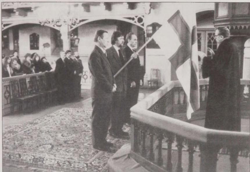
Joonis 32. ... ingerlased väga paljud said teada, et ingerlastel oli oma lipp kunagi olemas, oma rahvuslipp selline... Ingeri lipu õnnistamine Tartu Peetri kirikus 1988. aasta jõulude ajal.

Inimesed väga paljud said teada, et ingerlastel oli oma lipp kunagi olemas – oma rahvuslipp selline. Ja see lipp siis kujunes niiviisi, et see rahvuslipp on tegelikult lahingulipp. See tuli niiviisi, et kui käis see Eesti vabadusvõitlus 18-20 ja Vene punavägesid aeti teisele poole Narva jõge üsna kaugemale. Siis moodustati Ingeris kaks rügementi ingerlastest, kes võitlesid siis Eesti poole peal punaste vastu. Ja vat nendel kahel rügemendil oli siis see lipp – ristlipp, mille värvid on siis ümberpööratult Rootsi lipu värvid ja risti siis ääristab veel punane niisugune äär kah (mees, s 1953).