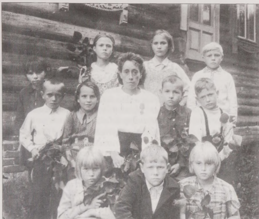
Joonis 11. Klassipilt – mälestus elust Venemaa kolkakülas. Foto: ERM Fk 2724:77

pottidega pliita peal soojaks ja siis pesti seal ahjus. Nii, et mina olen emaga koos ahjus saunas käinud. /.../