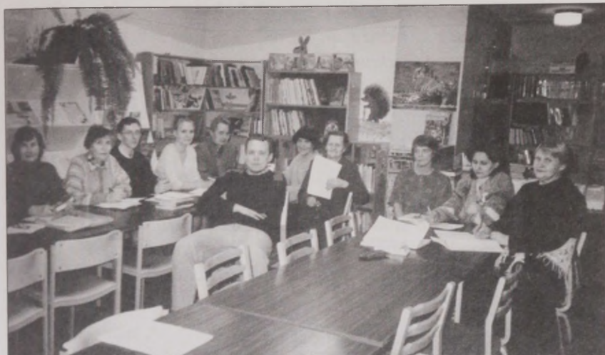
Joonis 24. Soome keele kursus Ida-Virumaa Ingerisoomlaste Seltsis.