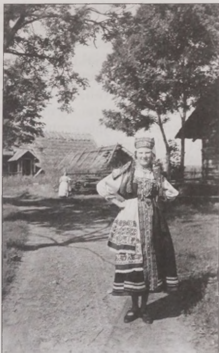
Joonis 42. Piltpostkaart Eesti-Ingerist 1930. aastatel.

Sõja järel põgenesid ingerisoomlased neile määratud elukohtadest Kesk-Venemaal ning ligi kolmandik siirdus Eestisse, mis ahvatles peamiselt keelelise ja kultuurilise lähedusega, kuid mitte vähem oluline ei olnud ka Eesti majanduslik paremus võrreldes ülejäänud Nõukogude Liiduga. Eestis algas ingerisoomlaste üsna kiire integreerumine Nõukogude Eesti ühiskonda, kuna tänu varasematele repressioonidele soovisid nad ise oma päritolu ja etnilist eripära varjata. Kõik ei mahu alati kehtivatesse raamidesse ja rajatud kategooriatesse, nagu nt ingerisoomlus Nõukogude Eestis, kus, tõsi küll, kehtivad kategooriad olid rajatud väljastpoolt ingerisoomlaste gruppi. Ühiskond markeeris nende ingerisoomlust repressiivse poliitikaga kuni 1950. aastate alguseni, kuid pärast seda jäeti nad iseenenda hooleks. Integratsioon toimus peaaesjalikult läbi töökollektiivide,