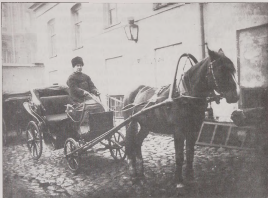
Joonis 36. ... osa käis juba siis ka Peterburis tööl. Ingerisoomlasest voorimees Peterburis teenistuses.

tühi-tähi asi. Nemad olid ikkagi impeeriumi pealinna vahetus läheduses. Nii Soome kui Eesti ... kõik muud olid perifeeria. Ja elu oli ju tükk maad vaesem ja kehvem, aga nemad olid ju pealinna ümbruse inimesed. Ja pealinna mõjud olid ju äärmiselt suured ja elulaadi mõjutas ja kõike. Tegelikult olid ju ingerlased äärmiselt rikkad just tänu sellele kaubavahetusele. Ütleme vanast ajast, mida nad on seal rääkinud. Siis olid neil kõigil seal majad, üks ole. Kui- gi see põllulapp ei olnud seal teab kui suur, üks kolm kuni neli hektarit. Kes oli hästi rikas, sel oli juba kümme. Kümme hektarit pealinna lähedal, see oli varandus.