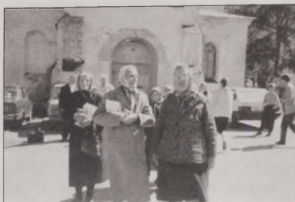
Joonis 27. ... see soomekeelne kirik! Narvas elavad ingerisoomed "mummod" tulevad suvel Kosemkin kirikust jumalateenistusele. Vt värvitahvel III.

tuse üleminekut. Ingerisoomse seltside esmafunktsiooniks oli rahvusliku tunde äratamine ja inimeste abistamine etnilise identiteedi taasloomisel, kuid peale selle oli tal ka mitmeid sekundaarfunktsioone, millest oli juttu eespool (osaleda laulukooris, käsitööringis, õppida soome keelt, reisida koos kooriga Soome, saada osa vanurite hoolekandesüsteemist või hoopiski seltsi abiga korraldada Soome ümberasumist). Eesti ühiskonda haaranud rahvusliku puhangu taandumine hõlmas ka ingerisoomlasi ja vähenes nende vajadus rahvusliku tunde rõhutamise järele.