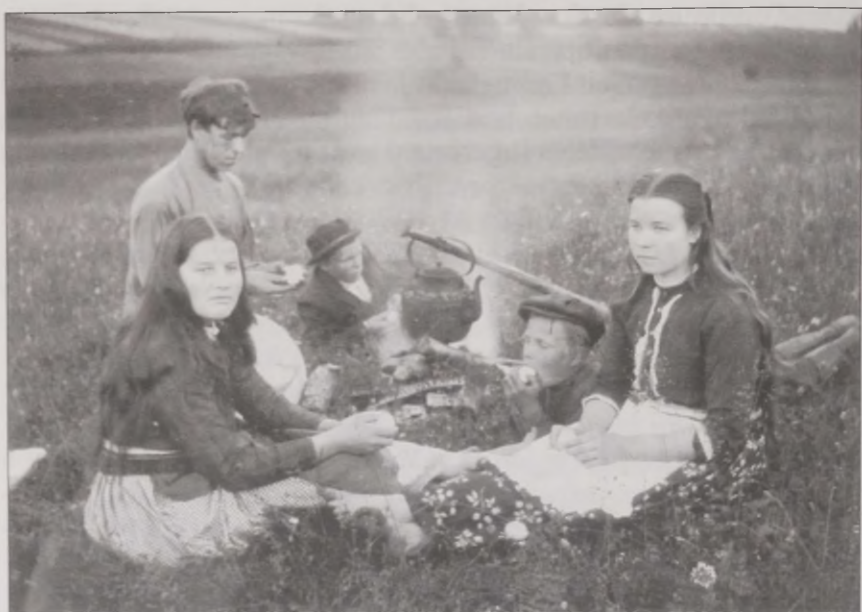
Joonis 37. Uusiküla noored 1913. aastal pühapäeva veetmas.