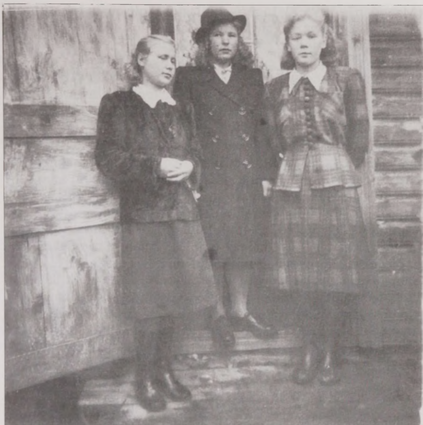
Joonis 13. Ingerisoomede sõbrannad 1953. aastal Valgamaal, Sassi sovhoosis. ERM Fk 2786:56

Kolmandaks võib seletust otsida “laulva revolutsiooni” ajal tekkinud olukorrast ja suhtumisest muulastesse. Esile kerkis küsimus, mida teha nõukogude ajal sisserännanud muulastega? Esimeses mõtte- ja sõnavabaduse õnnejoovastuses pääses nii avalikus kui ka meedias kõlama mõte, et muulased võiksid minna sinna, kust nad pärit on. Üks ingerisoomede päritolu eesti ajakirjanik kirjutab Eesti Ekspressis: “Ingerisoomlus hakkas end mulle eriti meelde tuletama laulva revolutsiooni ajal, mil kõik kõnelesid tundepuhanguga emakeelest, isamaast, juurtest ja sellest, et mõned võiksid üldse minna tagasi sinna, kust nad on tulnud”